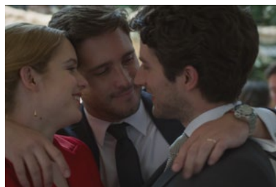
Kliknij, aby pobrać zdjęcie