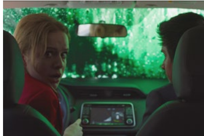
Kliknij, aby pobrać zdjęcie