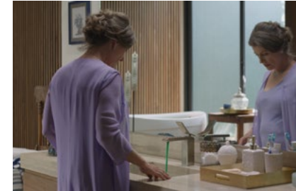
Kliknij, aby pobrać zdjęcie