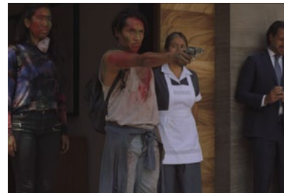
Kliknij, aby pobrać zdjęcie