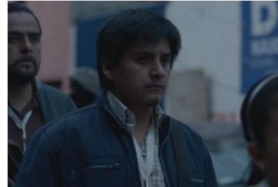
Kliknij, aby pobrać zdjęcie