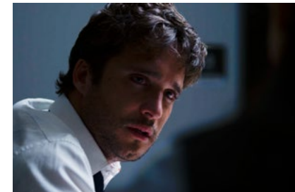
Kliknij, aby pobrać zdjęcie