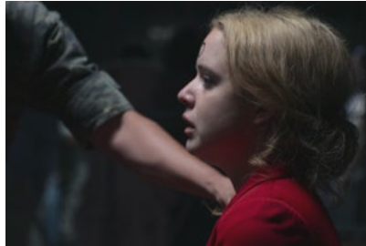
Kliknij, aby pobrać zdjęcie