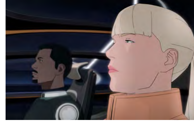
Kliknij, aby pobrać