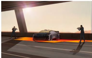
Kliknij, aby pobrać