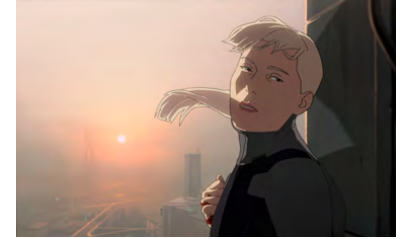
Kliknij, aby pobrać