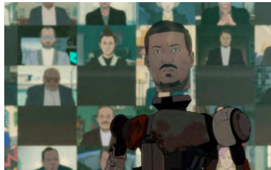
Kliknij, aby pobrać