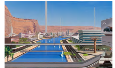
Kliknij, aby pobrać