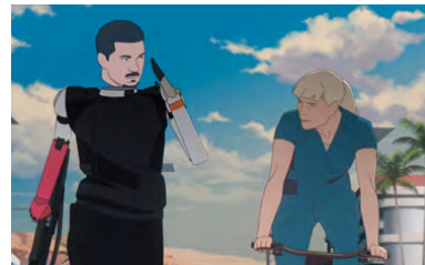
Kliknij, aby pobrać