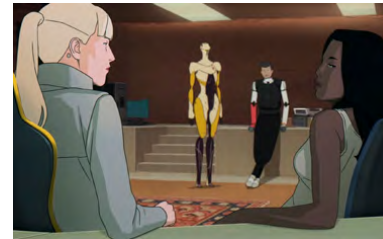
Kliknij, aby pobrać