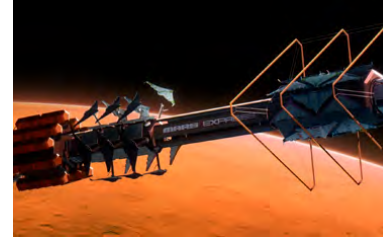
Kliknij, aby pobrać