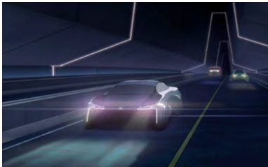
Kliknij, aby pobrać