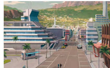
Kliknij, aby pobrać