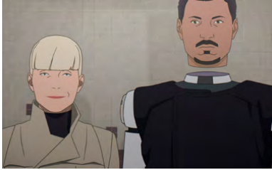
Kliknij, aby pobrać