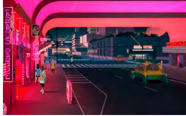
Kliknij, aby pobrać