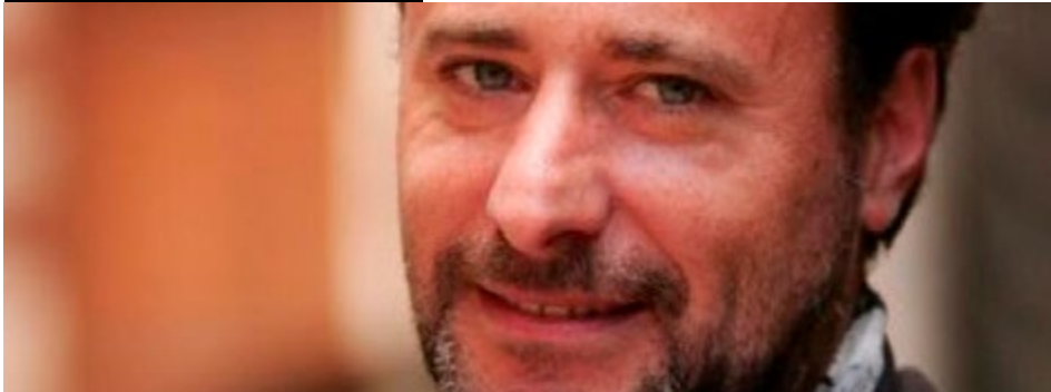
Philippe de Chauveron

Francuski reżyser i scenarzysta, urodzony w 1965 roku. Absolwent École Supérieure d'Études Cinématographiques (ESEC). Reżyserski debiut zaliczył w 1999 roku farsą o nieudanym wieczorze sylwestrowym pt. „Les Parasites”. W 2014 roku wyreżyserowana i napisana przez niego komedia „Za jakie grzechy, dobry Boże?” pobiła wszelkie rekordy frekwencyjne i zgromadziła ponad 17 milionów widzów we Francji. Film plasuje się na 15 miejscu najchętniej oglądanych filmów wszechczasów wśród francuskiej publiczności.