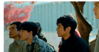
Kliknij, aby pobrać