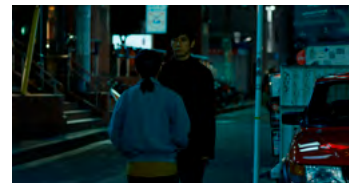
Kliknij, aby pobrać