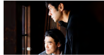
Kliknij, aby pobrać