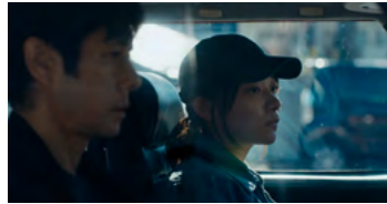
Kliknij, aby pobrać