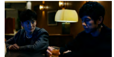
Kliknij, aby pobrać