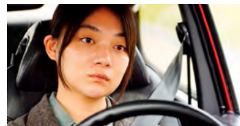
Kliknij, aby pobrać