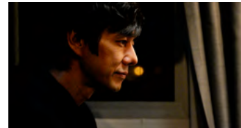
Kliknij, aby pobrać