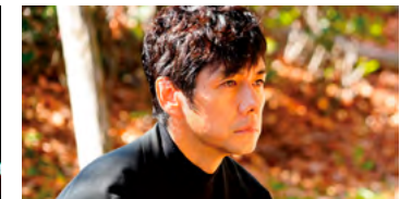
Kliknij, aby pobrać